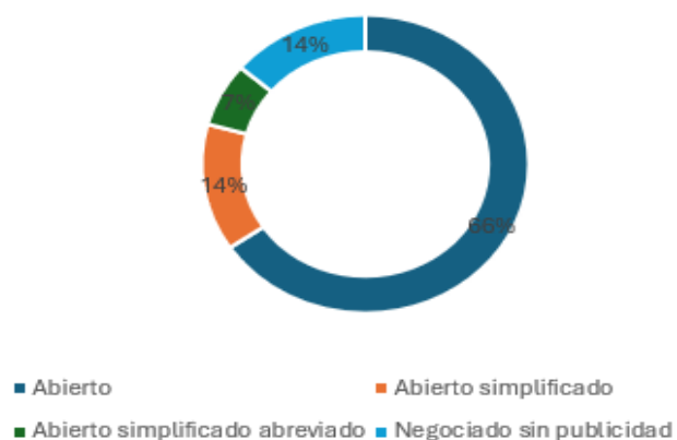
Tipo de procedimiento